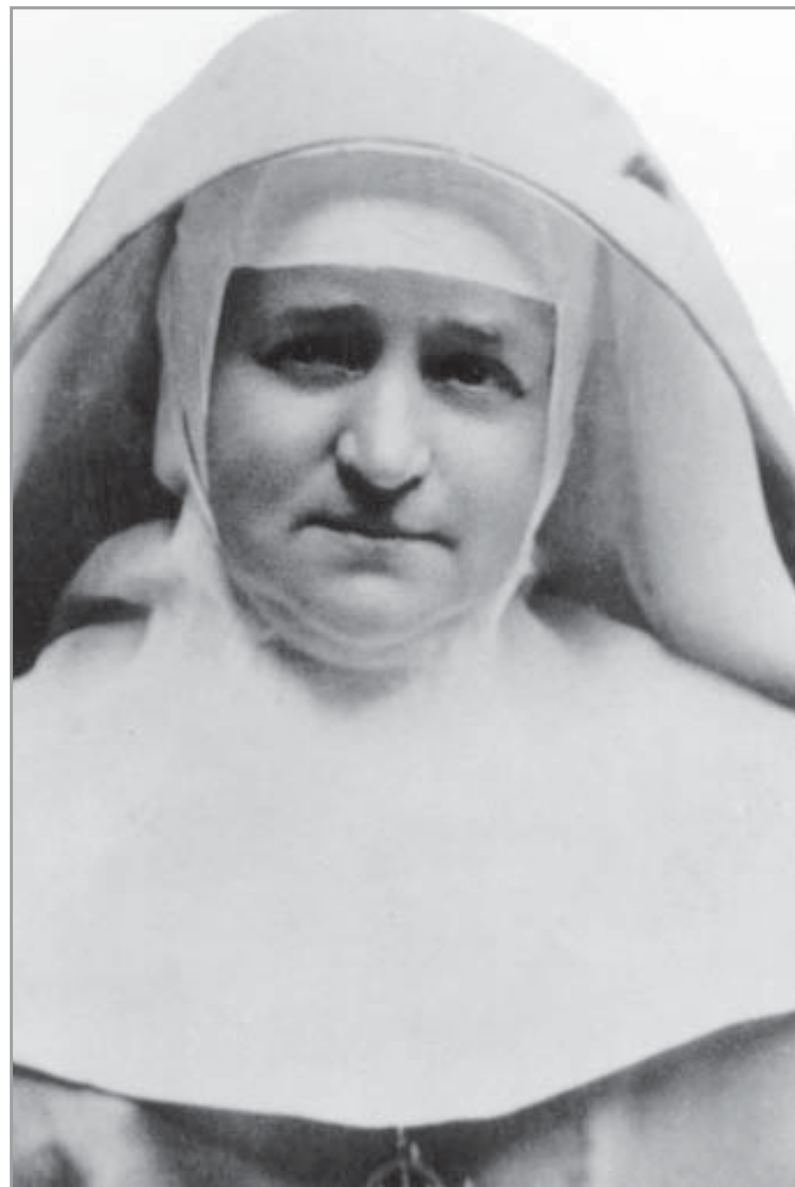
Beata Carmen Sallés Y Barangueras Fundadora da Congregação de Religiosas Concepcionistas Missionárias do Ensino

SEDE PROVINCIAL: Rua Humberto I, nº 395 - Vila Mariana Cep: 04018-041 - São Paulo - SP - Brasil www.concepcionistas.com.br