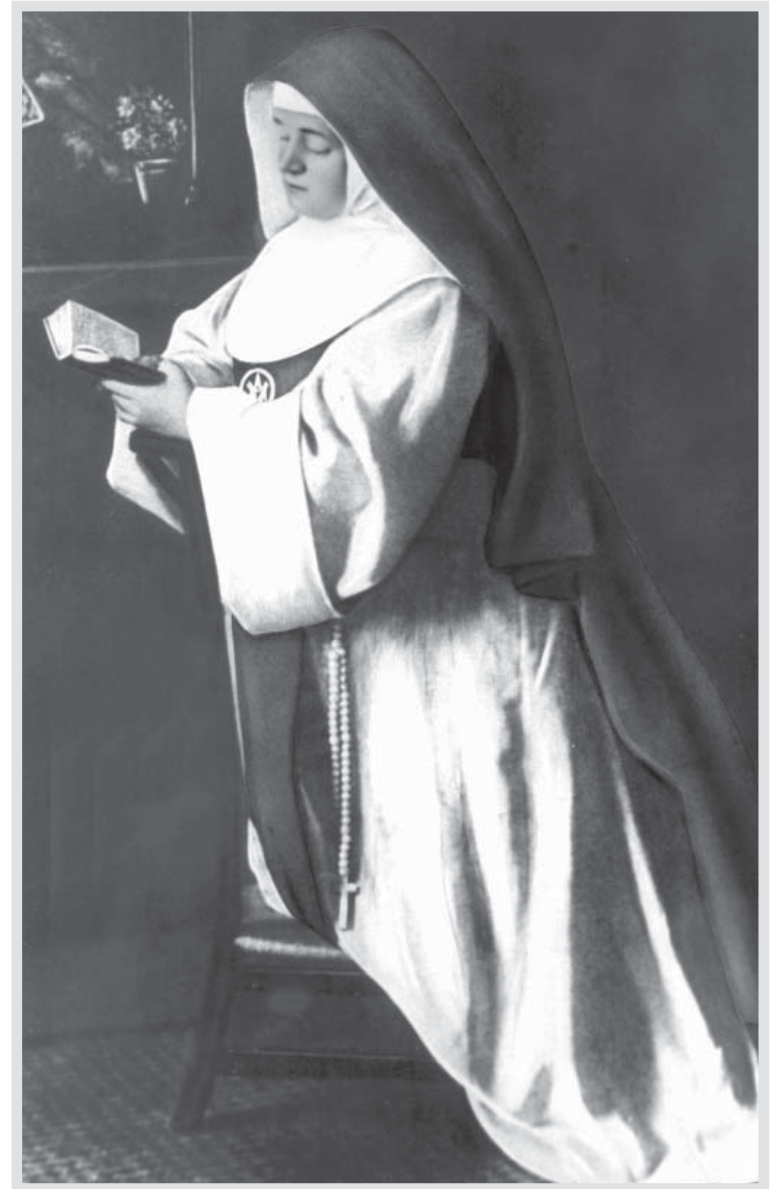
Imagem da Capa: Museu Carmen Sallés - Marcilla - Espanha

Produção Gráfica: Ednilson Silva Coelho Impressão: Grupo Impressor - São Paulo - SP